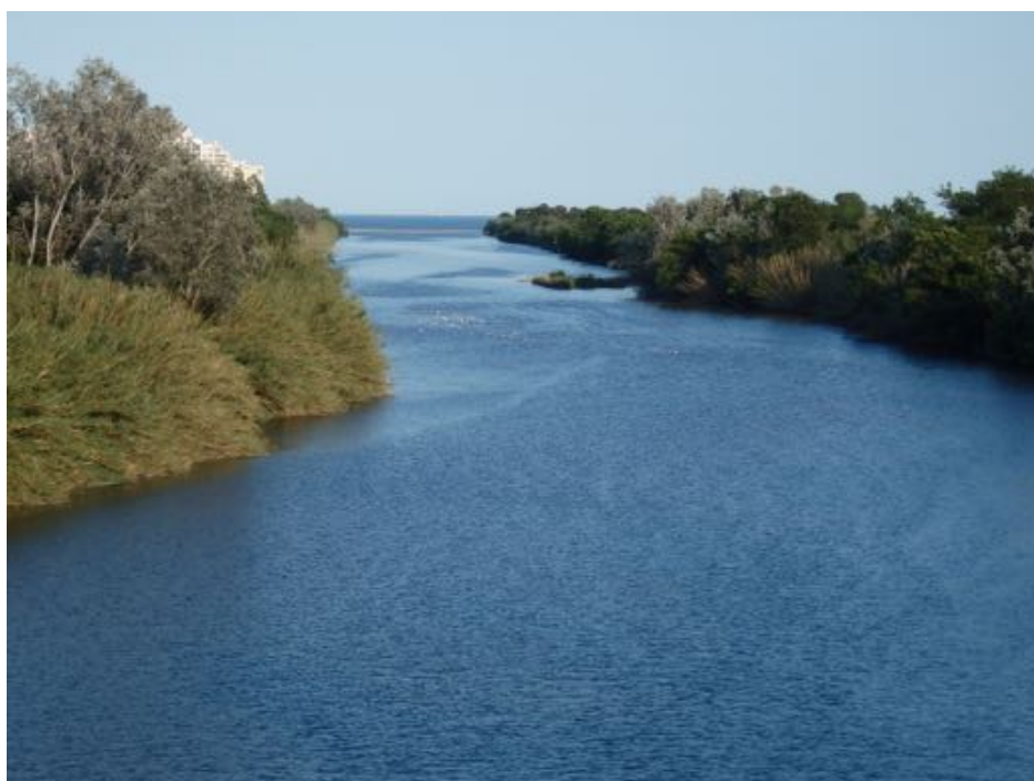
La Muga a Castelló d'Empúries/Aiguamolls de l'Empordà.