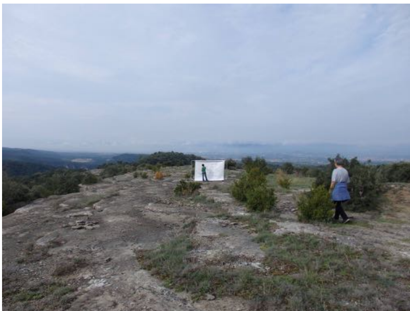
Alicia Casadesús. Instal·lació i performance a Can Tafura, l'Esquirol.