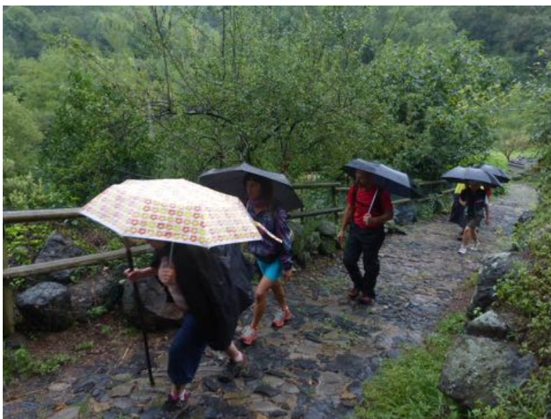
Caminant per la Garrotxa sota la pluja.

Grand Tour és una aposta i en la seva primera edició ha superat les nostres expectatives. El grup que més directament va viure el viatge i que més fermament aposta per una nova edició està format per professionals de la gestió cultural, artistes i sobretot per persones que hi van trobar en l'experiència alguna cosa inèdita que els ha seduït profundament. Aquest és el nostre millor capital i amb ell encetarem la segona edició el 2016.