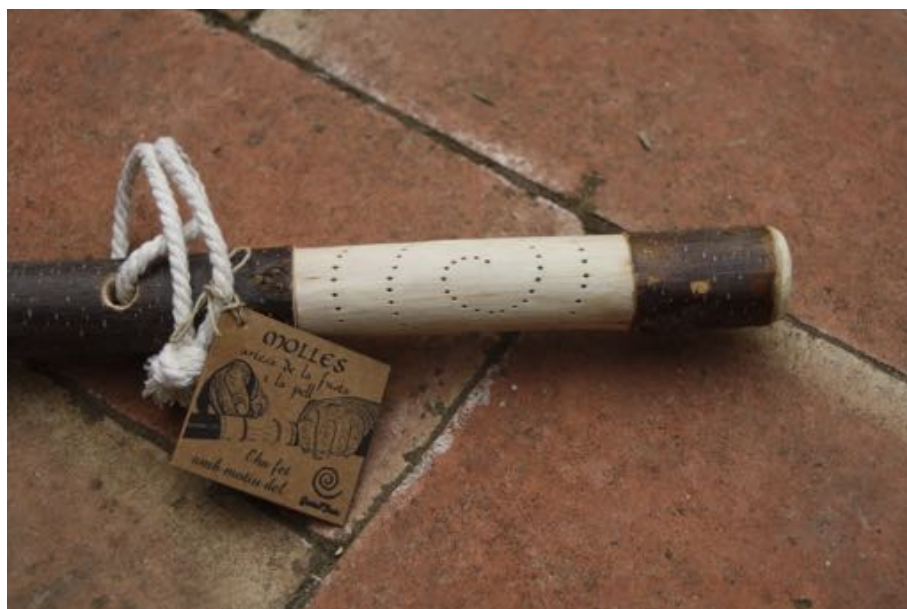
Bastó oficial de Grand Tour dissenyat i realitzat per l'artesà Molles de Torrelles de Llobregat

Els primers col·laboradors però, han estat els artistes. Amb les seves creacions, la seva generositat i la seva hospitalitat han fet possible aquest projecte.