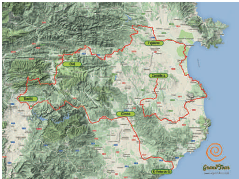
Disseny & logo: Jordi Lafon

Es va fer una festa inicial el dia 22 d'agost que va servir també per presentar les etapes del viatge i aplegar tots els artistes participants. L'espiral va sortir de Nau Còclea el 26 d'agost, el viatge va durar 19 dies i va recórrer les comarques dels dos Empordans, Gironès, Garrotxa, Osona i Selva per acabar a Sant Feliu de Guíxols el 13 de setembre.